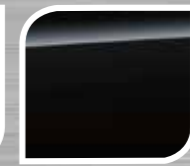
Crystal Black Silica