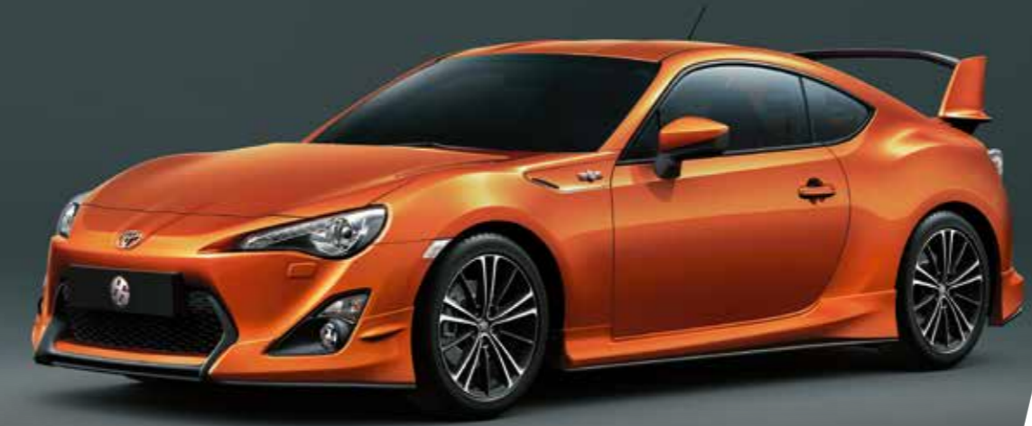
Tampilan bumper dengan lips, side skirt, dan spoiler belakang yang besar, memperkuat konsep aerodinamis dari 86 Aero.

Tanda kemenangan hari Anda dimulai saat deru nafas mesin Boxer FA20 dihidupkan. Kemampuannya yang luar biasa serta bobot mesin yang seimbang tetap menjuarai kenikmatan serunya berkendara bagi semua kalangan.