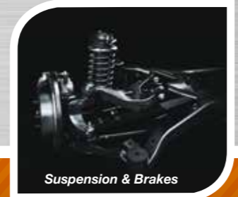
Suspension & Brakes