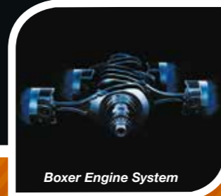
Boxer Engine System