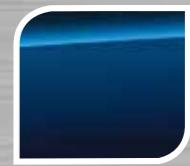
Galaxy Blue Silica

TRD hanya tersedia dengan warna Satin White Pearl, Crystal Black Silica, Orange ME & Lightning Red.