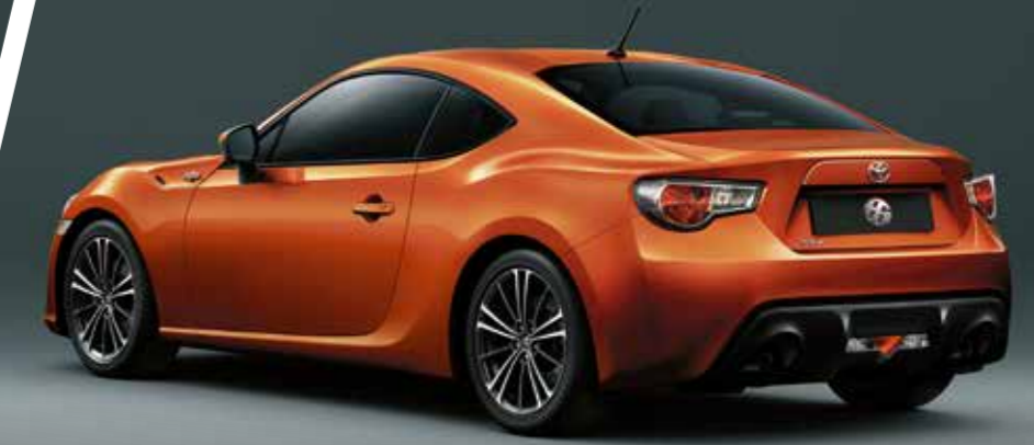
Tampilan minimalis dan tersedianya pilihan antara 6-speed M/T dan A/T ditujukan untuk memaksimalkan kepuasan para pengendaranya.